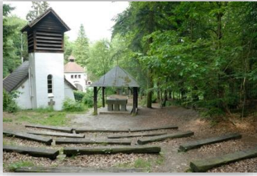
Gebouwenkamp Hopper De Kluis